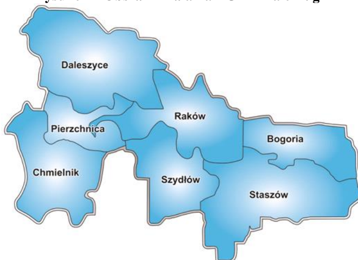
Rysunek 1 Obszar Działania LGD "Białe Ługi"

członkiem innej Lokalnej Grupy Działania ani podmiotem, który zobowiązał się do współpracy w zakresie realizacji LSR z inną LGD.