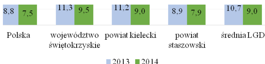
Wykres 4 Stosunek liczby bezrobotnych do liczby osób w wieku produkcyjnym (%) – porównanie dla Polski, województwa świętokrzyskiego, powiatu kieleckiego i powiatu staszowskiego oraz obszaru LGD w 2013 i 2014 r.

Źródło: Opracowanie własne na podstawie danych GUS